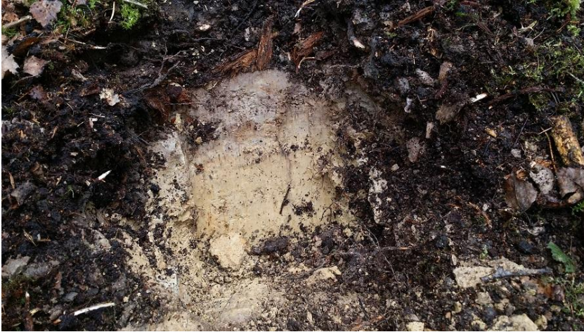
Erdreich der Umgebung der Anomalie