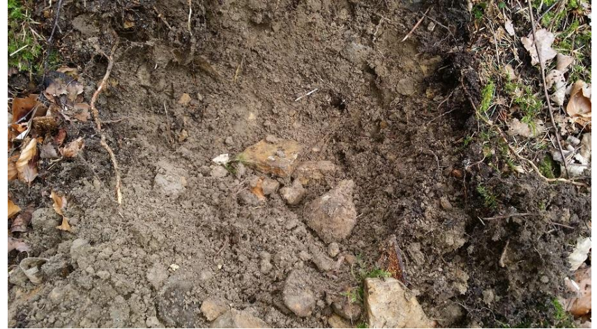
Erdreich der Anomalie